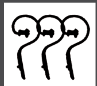
Drei Zinkenreihen Gerader Zinken 45x10 mm