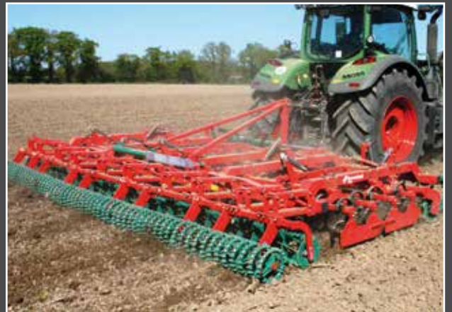
Kombination mit Krümler- und Crosskillwalzen.