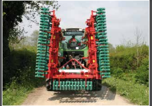
Nur 2,50 m Transportbreite.