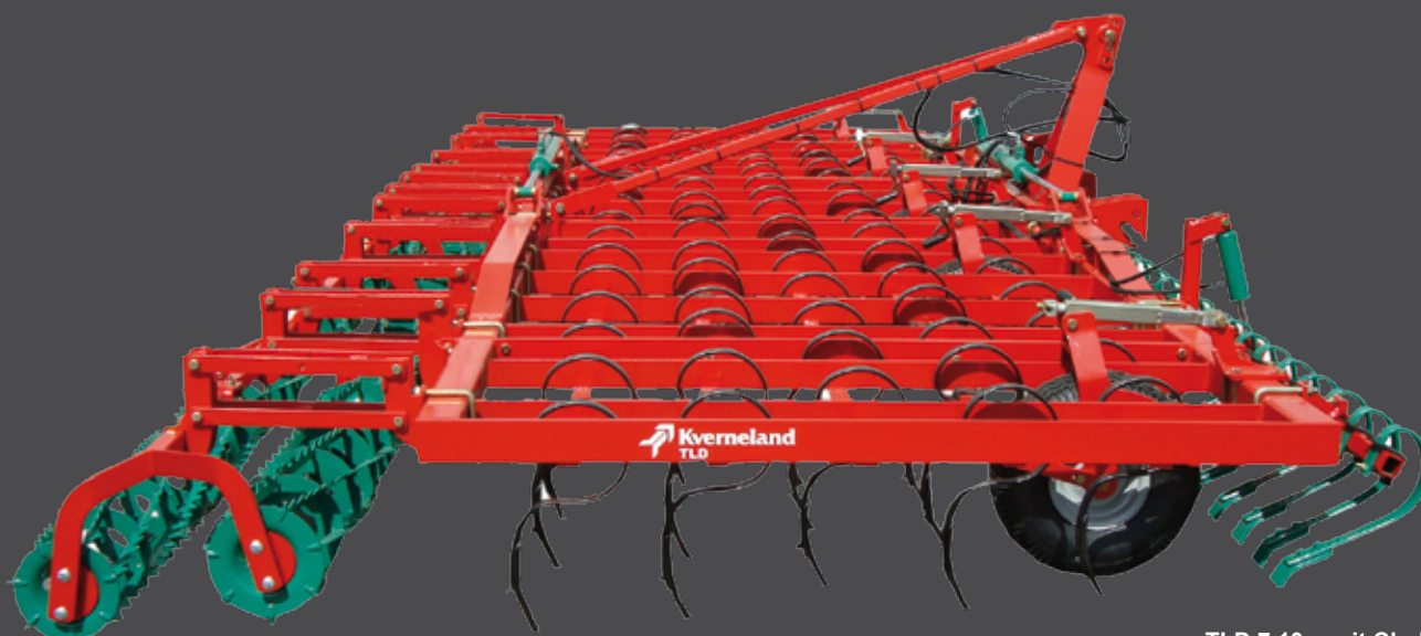
TLD 7.10m mit Clod Board und Doppelkrümmerwalze

Die Modelle TLC und TLD sind serienmäßig mit luftbereifte 600/9 x 10 Räder ausgestattet.