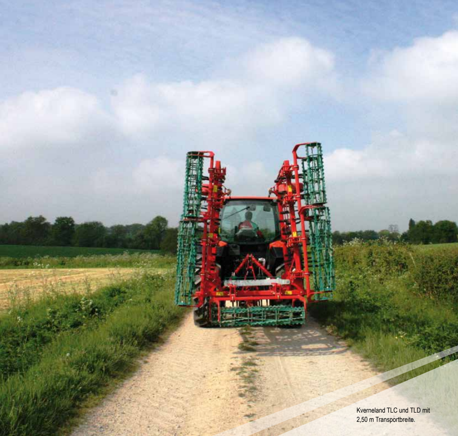
Kverneland TLC und TLD mit 2,50 m Transportbreite.