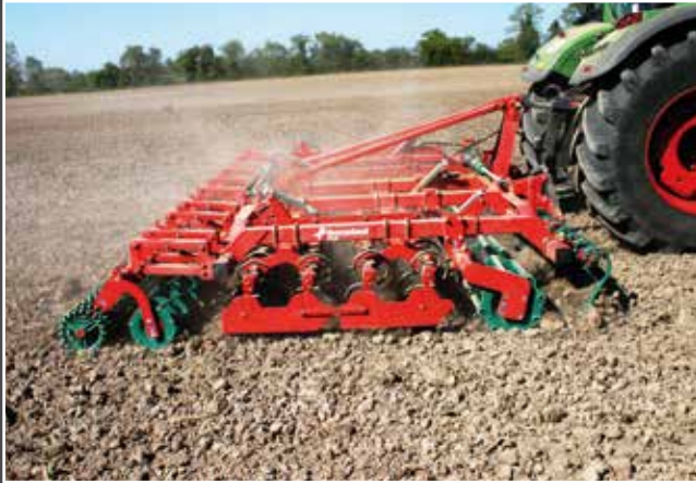
TLG ausgerüstet mit Clod Board und einer Krümler-Crosskillwalzen Kombination