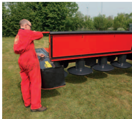
Die vordere Schutzabdeckung kann weit geöffnet werden.