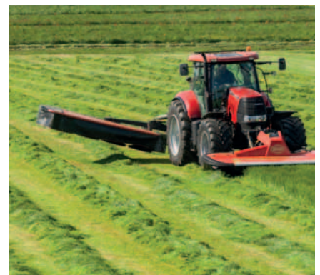
Ausreichende Aushubhöhe am Vorgewende.