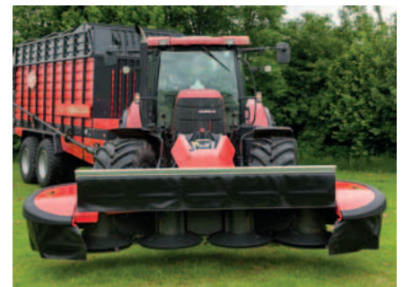
Die vordere Schutzabdeckung kann weit geöffnet werden.