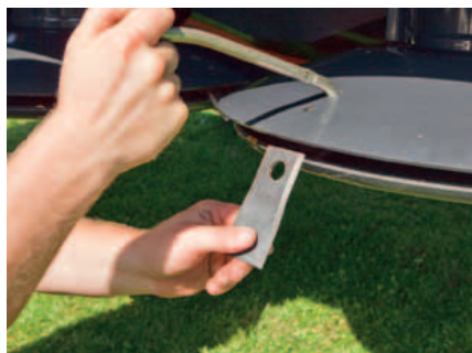
Klingenschnellwechsel – Werkzeug herunterdrücken und die Klingen wechseln.