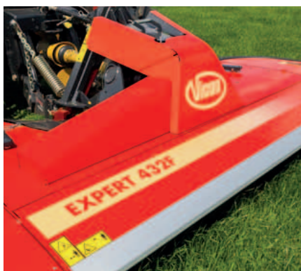
Keilriemen werden über eine Feder gespannt.