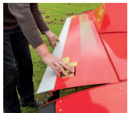
Alle Griffe, die bei der täglichen Arbeit genutzt werden, sind gut erkennbar und zugänglich.