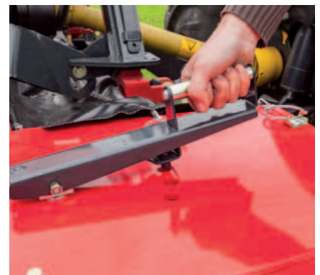
Die Schwadscheiben lassen sich einfach und schnell von oben einstellen.

Der Antrieb der Mäheinheit erfolgt mit Keilriemen. Der Keilriemenantrieb ist gleichzeitig ein Schutz gegen Überlastung und verhindert auch Schäden, die durch Auftreffen auf ein Hindernis entstehen können. Die Keilriemen werden über eine Feder automatisch gespannt.