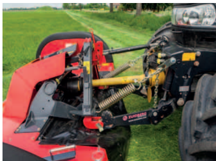
Perfekte Boden Anpassung.