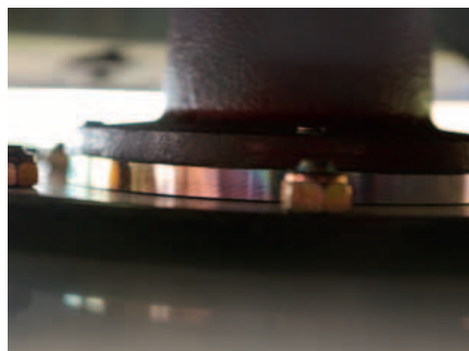
Stufenlose Schnitthöhenverstellung gehört zur Serienausstattung.