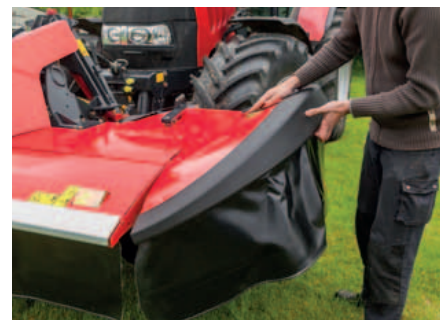
Seitliche Schutzabdeckungen sind für den Straßentransport einfach klappbar.