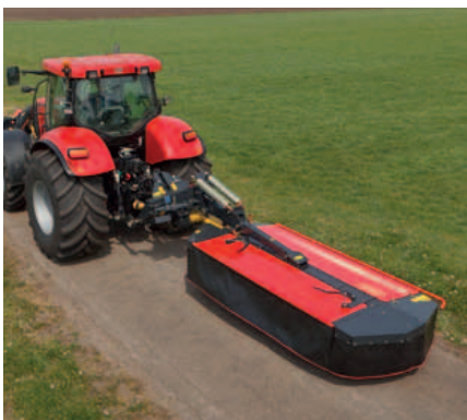
Für den Straßentransport wird das EXPERT 431 vertikal eingeklappt.

Auch in der Vorgewendestellung ist der Verlauf der Gelenkwelle absolut gerade. Dies ist ein Argument dafür, dass keine Vibrationen auf den Schlepper und das Mähwerk übertragen werden.